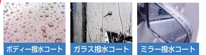
ボディー撥水コート